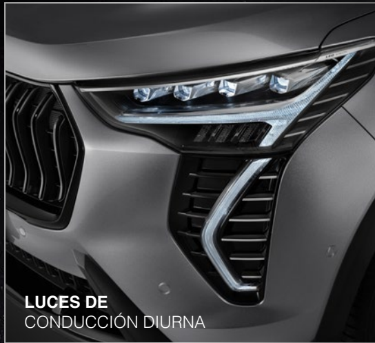
LUCES DE CONDUCCIÓN DIURNA