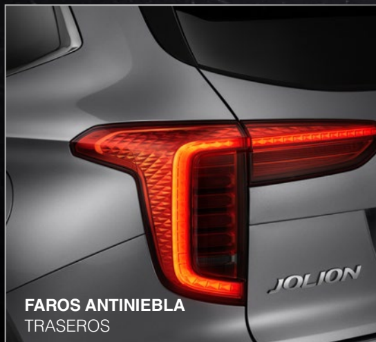
FAROS ANTINEBLA TRASEROS